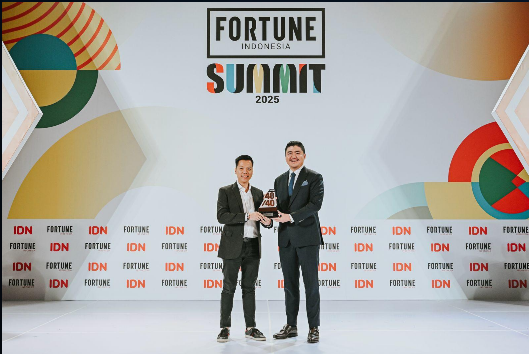
40 Under 40 Fortune Indonesia Summit 2025