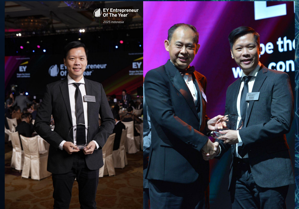
EY Entrepreneur of The Year Indonesia 2025