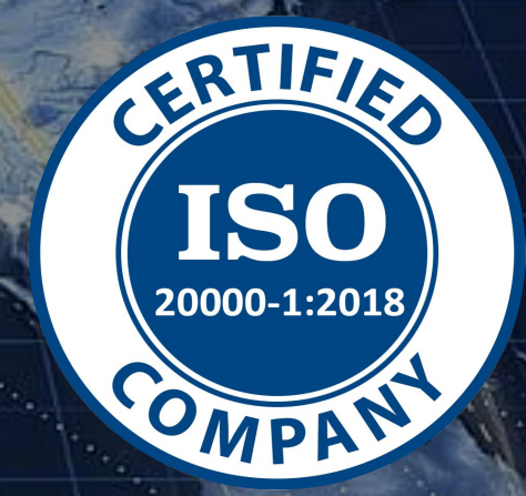
Service Management System