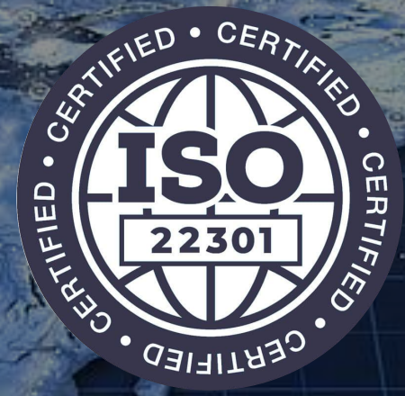
Business Continuity Management System