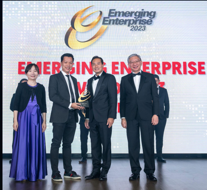
Emerging Enterprise Award Singapore