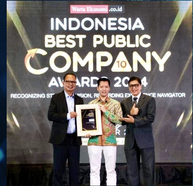
Indonesia Best Public Company Award