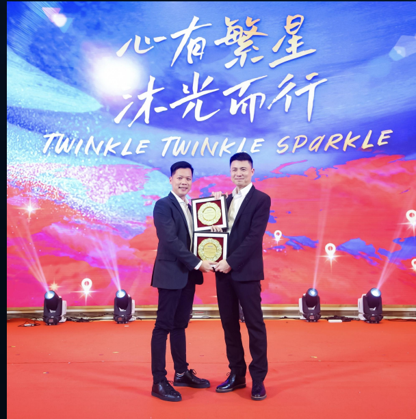
Largest GPS Product Marketing Company in Southeast Asia